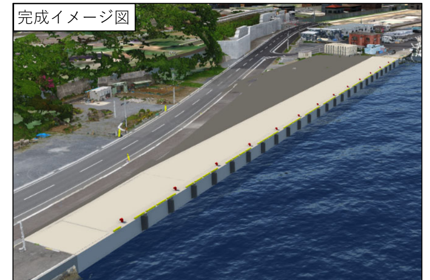
(岸壁背後の駐車場整備はR8年度施工予定)

施工者 : 株式会社 佐賀組 TEL : 0192-29-2730 (大船渡事業所)